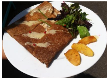
La Ch'ti mimi